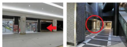
← の方向に進み ○ の自動ドアへ