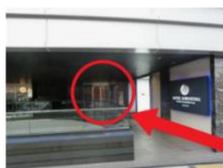
自動ドアに入って右手にエレベーターがあります