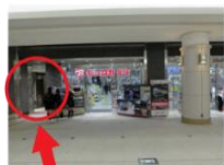
ここに入って左手にエレベーターがあります