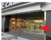
自動ドアに入って右手にエレベーターがあります